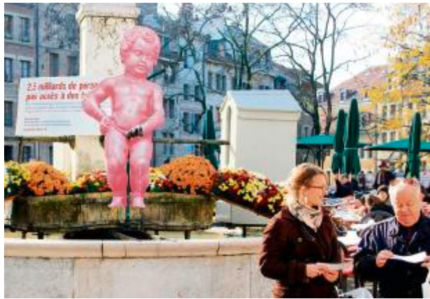
Les badauds se sont montrés interloqués par l'installation.